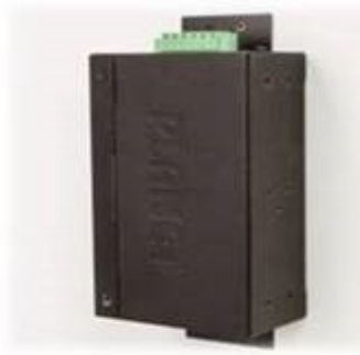
Wall mounting (Space saving)