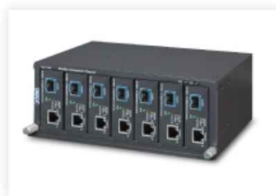
Media Chassis Installation